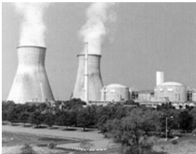
照片 1 印度 Kakrapar 核電廠 1、2 號機