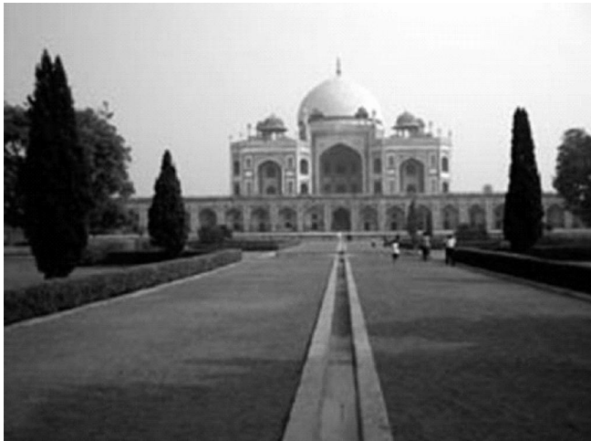
照片 2 世界遺產胡馬雍陵墓

印度的人口約 12 億人，約日本的 10 倍，平均每人電力消費量約日本的十分之一，聽說現在印度的 3 種神器是冷氣機、彩色電視及洗衣機，令人想起往昔的日本，預期未來電力的成長率相當強勁，變成 2 倍、3 倍是遲早的問題，因此才有前述那樣的大規模核能建設計畫。